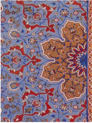
Konya Sultan Selim Camii kalem işleri (16.y.y.)