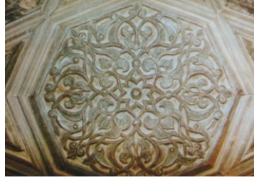
Künde-kari tekniğiyle minber motifleri