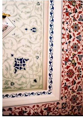
Mehmet Başbuğ'un evi (2008-Konya)