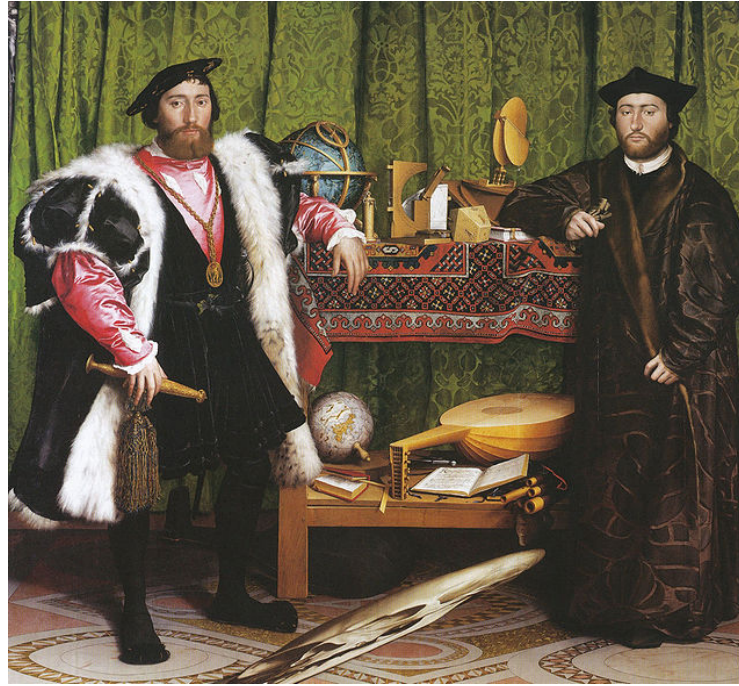
Hans Holbein, Elçiler, 1533

Dünyanın gerçekliğine şahit olan batılı ressam, şahitliğini Rönesans ressamlarının öncülerinden olan Jan Van Eyck'in ilk resimlerinden beridir sürdürmektedir. Bu metinde ele alınan eser de görüneni kılı kırk yararcasına ayrıntılı çalışarak göstermeye çalışan kuzey Avrupalı ressam Hans Holbein'in meşhur Elçiler adlı eseridir. Bu eserin metne konu olmasını sağlayan şey, eserin tıpkı Nakkaş Osman'ın eseri gibi elçileri konu edinmesidir. Diğer yandan bu eser gerek iç mekân gerek mekân içinde yer alan figürler ve objelerin düzenlenişi 16. Yy. Avrupa'sının kültürel evrenini bir şekilde ifşa etmesi bakımından da dikkat çekicidir.