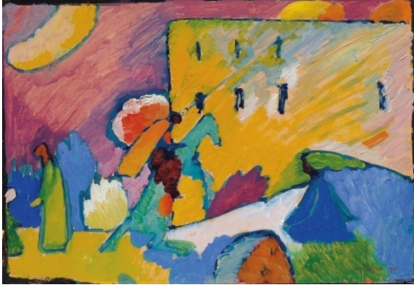
Resim.2: Doğaçlama/Improvisation, 3

Üstte yer alan, 1909 yıllarında yapılmış olan Doğaçlama/ Improvisation, 3 çalışmasında şaha kalkmış bir at ve atın üzerinde bir adam görülmektedir. Sol tarafta ise dizlerinin üzerine çökmüş bir figür ve ayakta duran başka bir figür bulunmaktadır. Geri planda ise manzara ve yapılar görülmektedir. Eser dinsel bir resim görüntüsü vermektedir ve ruhani bir ortam sunmaktadır (Yılmazok, 2015). Sanatçı burada maddi ve manevi duyguyu bir arada vermek istemiş olabilir.