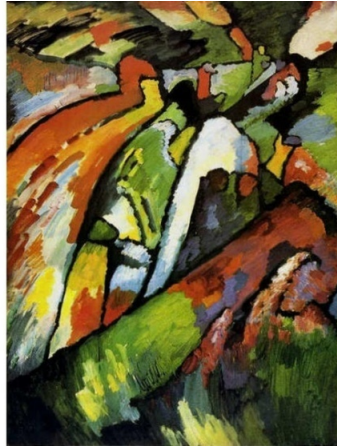
Resim.1: Doğaçlama/ Improvisation, 7

Sanatçı doğaçlama çalışmalarında Sanatta Tinsellik Üzerine adlı kitabında yer verdiği felsefi görüşlerden etkilenmiştir. Ruha yönelme, ruha dokunma, görünenin ardındaki gerçeği keşfetme gibi düşüncelerle 35 resimden oluşan doğaçlama çalışmalarını oluşturmuştur.