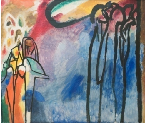
Resim.3: Doğaçlama/Improvisation 19

Üstte yer alan, 1909 yıllarında yapılmış olan Doğaçlama/ Improvisation, 3 çalışmasında şaha kalkmış bir at ve atın üzerinde bir adam görülmektedir. Sol tarafta ise dizlerinin üzerine çökmüş bir figür ve ayakta duran başka bir figür bulunmaktadır. Geri planda ise manzara ve yapılar görülmektedir. Eser dinsel bir resim görüntüsü vermektedir ve ruhani bir ortam sunmaktadır (Yılmazok, 2015). Sanatçı burada maddi ve manevi duyguyu bir arada vermek istemiş olabilir.