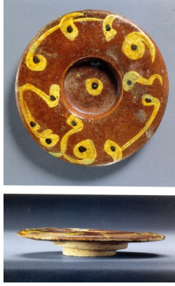
Resim 5: Tabak, 11. yüzyıl, y: 2,1 cm, ç: 11,8 cm, (Watson, 2004: 219).