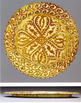
Resim 3: Tabak, 9. yüzyıl, y: 2,4 cm, ç: 35,5 cm, (Watson, 2004: 190).

Selçuklu döneminde seramikten üretilen düz tabak grubu kendi içerisinde alt gruplar oluşturmaktadır. Günümüze gelen örneklerden yararlanılarak bu döneme ait beş alt grubun varlığı tespit edilmiştir (Resim1-2-3-4-5). Bu grup tabaklarında yükseklik, tabağın ağız genişliğine göre daha azdır. Bu tabaklar, kâselerin taşınmasında altlık olarak üretilmiş olabilecekleri gibi sıvı içermeyen yiyeceklerin konulması amacıyla da kullanılmış olabilirler.