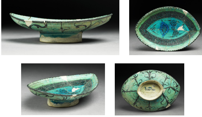
Resim 13: Tabak, 13. yüzyıl, y: 5,5 cm, ç: 19,7 cm, http://jameelcentre.ashmolean.org/collection/921/per_page/50/offset/900/sort_by/date/category/ceramics/object/12974 16.1.2019 Erişim Tarihi: 16.01.2019).