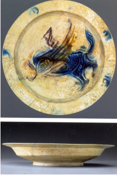
Resim 9: Tabak, 12. yüzyıl, y: 5,5 cm, ç: 30,2 cm, (Watson, 2004: 291).