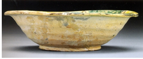
Resim 12: Tabak, 9. yüzyıl, y: 4,1 cm, ç: 15,4 cm,(Watson, 2004: 169).