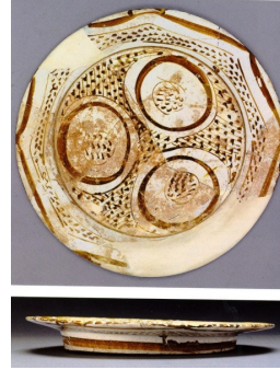
Resim 4: Tabak, 10. yüzyıl, y: 4,5 cm, ç: 23,1 cm, (Watson, 2004: 194).