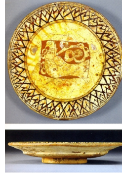
Resim 10: Tabak, 12-13. yüzyıl, y: 4 cm, ç: 24 cm, (Watson, 2004: 263).

Selçuklu döneminde üretilmiş olan çukur tabakların kullanım amaçları bilinmemekle birlikte çeşitli varsayımlarda üretildiği bilinir. Tabakların çukur olması sebebi ile sıvı içeren yiyecekler için idealdir. Bununla birlikte salata, meyve gibi yiyeceklerin konabilmesi de mümkündür.