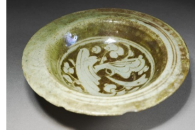
Resim 11: Tabak, 12. yüzyılın sonları-13. yüzyılın ilk yarısı, y: 4,5 cm, ç:16 cm,( http://jameelcentre.ashmolean.org/collection/8/per_page/50/offset/0/sort_by/date/object/10943 erişim Tarihi: 25.09.2019)