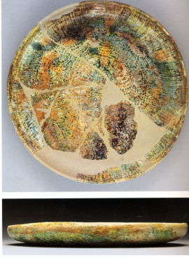
Resim 1: Tabak, 9. yüzyıl, y: 4 cm, ç: 34,5 cm, (Watson, 2004: 168).