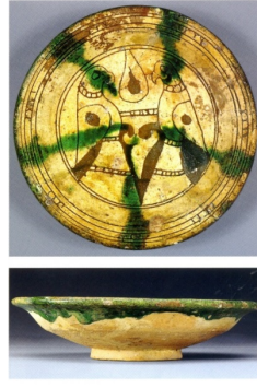
Resim 7: Tabak, 12-13. yüzyıl, y: 4,6 cm, ç: 19,5 cm, (Watson, 2004: 263).

Selçuklu dönemi seramiklerine ait çukur tabaklar altı ayrı tipte yapılmıştır (Resim 6-7-8-9-10-11-12). Bunlardan Resim 9-10’da bulunan eserlerin dış görünüşleri birbirine benzerlik gösterdiği için aynı grubun içerisinde değerlendirilmiştir. Bu iki eser ölçü olarak birbirinden farklıdır.