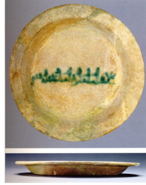
Resim 2: Tabak, 10. yüzyıl, y: 3,3 cm, ç: 29,5 cm, (Watson, 2004: 179).

Selçuklu döneminde seramikten üretilen düz tabak grubu kendi içerisinde alt gruplar oluşturmaktadır. Günümüze gelen örneklerden yararlanılarak bu döneme ait beş alt grubun varlığı tespit edilmiştir (Resim1-2-3-4-5). Bu grup tabaklarında yükseklik, tabağın ağız genişliğine göre daha azdır. Bu tabaklar, kâselerin taşınmasında altlık olarak üretilmiş olabilecekleri gibi sıvı içermeyen yiyeceklerin konulması amacıyla da kullanılmış olabilirler.