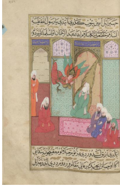
Resim: 9 Hz. Muhammed Abdurrahman ile konuşurken, Cebrael'in gelip Abdurrahman için cennette bir yer ayırdığını söylediği sahne, TSMK H. 1223, 376a