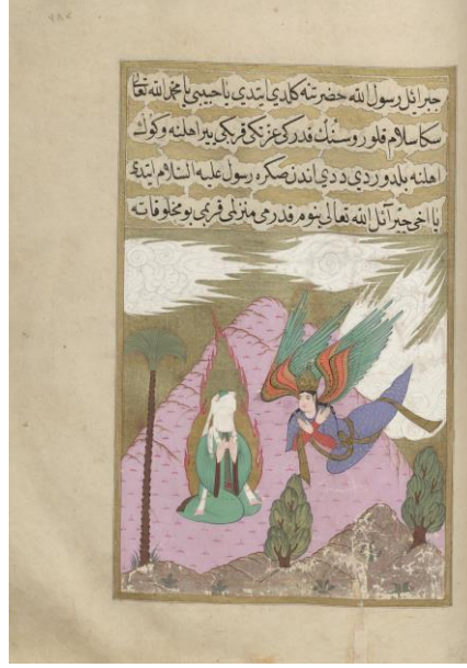
Resim:3 Cebrail'in Hz. Muhammed'e Tanrı'nın selamını getirdiği sahne, TSMK H. 1222, 382a.