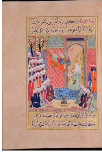
Resim: 3 Bedir savaşında elde edilen ganimetlerin paylaşılması ile ilgili olarak Cebrail'in Hz. Muhammed'e bir ayet getirme sahnesi, TIEM 1974, 283a.