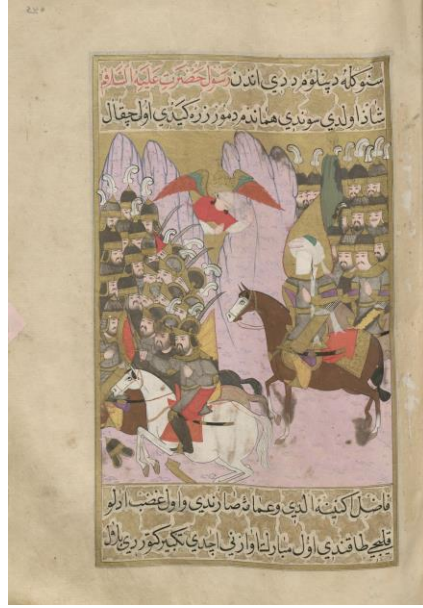
Resim: 7 Cebrail'in Hz. Muhammed'e cesaret vermesi üzerine Hz. Muhammed'in düşman üzerine yürüdüğü sahne, TSMK H. 1223, 330a.