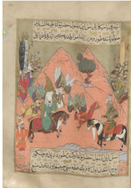
Resim: 4 Cebrail, Mikail, Azrail'in, Esced b. Guveylime ile teke tek dövüşe hazırlanan Hz. Muhammed'in yardımına gelmesi sahnesi, TSMK H. 1223, 176a.