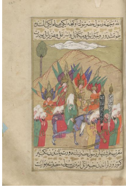
Resim: 6 Mekke'ye giden Müslüman ordusuna Cebrail, Mikail, İsrail ve Azrail'in de eşlik ettiği sahne, TSMK H. 1223, 298a.