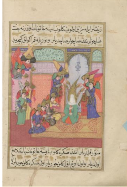
Resim: 2 Hz. Muhammed'in doğacağı an meleklerin Âmine'ye cennet saçları saçması sahnesi, TSMK H. 1221, 217b.