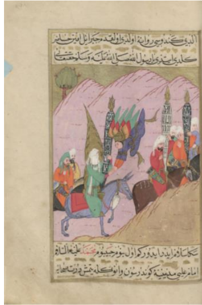
Resim: 10 Cebrael'in, Hz. Muhammed'e Ali'yi Medine'ye göndermesini söylediği sahne, TSMK H. 1223, 378a.