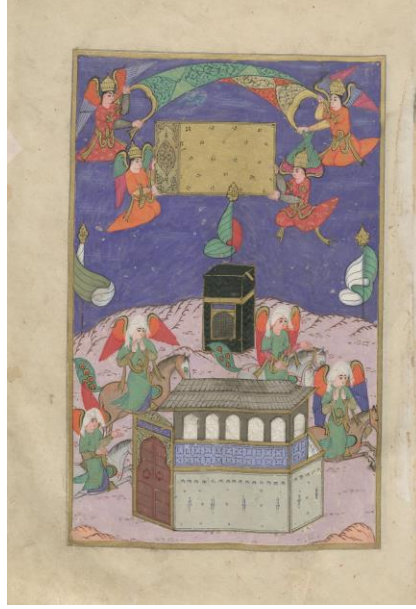
Resim: 1 Hz. Muhammed'in doğacağı gece annesi Âmine'ye görünen olayların gösterildiği sahne. Melekler yerle gök arasına ipek döşek serer, atlı ve kanatlı melekler doğuya, batıya ve Kâbe'nin damına birer sancak dikerek, Âmine'nin babasının evini tavaf ederler, TSMK H. 1221, 214a.