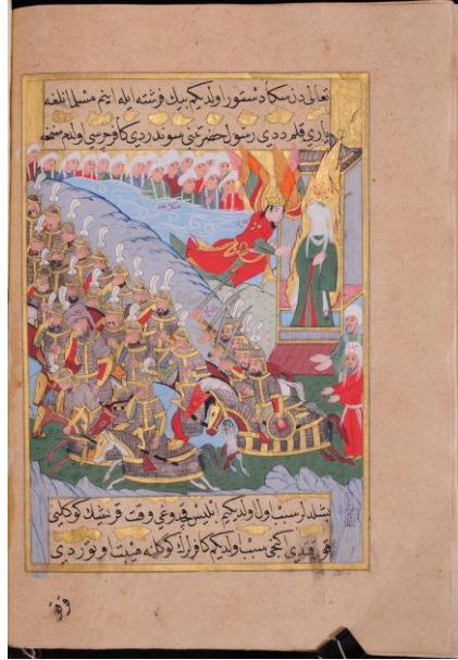
Resim: 12 Cebrail ve diğer meleklerin, Bedir savaşı sırasında Müslümanların yardımına gelmesi sahnesi, TİEM 1974, 263b.