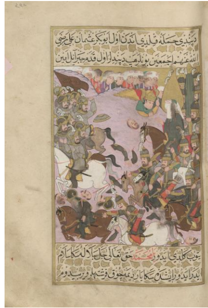
Resim: 8 Hz. Muhammed ve ordusu Huneyn'de savaşırken, Cebrail'in meleklerle gelip, Hz. Muhammed'e onunla birlikte olduğunu söylediği sahne, TSMK H. 1223, 338a