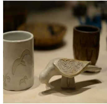
Görsel 9. Kuş temalı nesnelere

Füreyya Koral, seramikten yaptığı ve bir mahalle oluşturduğu "Seramik Evler" de yine kuş figürlerini kullanmıştır. Kapısı penceresi olan bu evlerde ya çatılarda ya da pencerelerde kuşlar görülür.