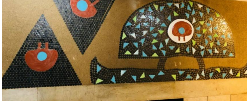
Görsel 4. Elmadağ Ka Han Duvar Panosu

Füreyya Koral kendisinin sergilerinde de sıklıkla düz formlar üzerine bu kadar düşmesinin sebebini merak ettiklerinden bahseder. Kendi deyimi ile; “ilk başladığımda geleneğimizin çizgisinden gitmek istedim. Duvar panoları yaptım. İlk sergimi açınca sordular, ‘Niye düz şeyler yaptınız da objeler yapmadınız? Seramik obje demektir’ dediler. Tartışmalar oldu o zaman. Ben bir duvar çinisi vardır dedim, bu da bizim geleneğimizdir. O yoldan gitmek istiyorum. Bunu yapmak gerekliydi. Çünkü yeni bir mimari türü başlamış ülkemizde. Beton. Orada, geleneğimizde olmayan vitray, fresk kullanmaktansa niçin çini kullanmayalım?” (Antmen,2017). Kendisi böylelikle geleneksel sanatları mimari alanlara yansıtarak gelenek ile mimariyi birleştirmeyi başardı. Koral, pek çok seramik sanatçısının halen etkisinde kalarak kullanmakta olduğu Hitit dönemi sanatından da etkilenmiş bunları da bir dönem kullanmıştır. Bu etkiyi pek çok eserinin yanında 20. yüzyılda Elmadağ’da yapmış olduğu bir duvar panosunda da görebiliriz.