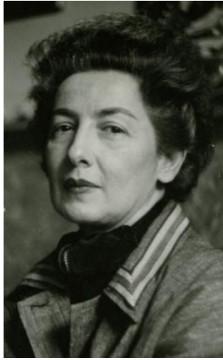
Görsel 1. Füreyâ Koral

İlk seramik fabrikasından günümüz seramiğine kadar gelişen dönemde bu sanat dalı endüstri alanının yanında sanat alanında da estetik değer kazanır. Türkiye'de 1950'li yıllarda Tatbiki Güzel Sanatlar Akademisinin kurulması ve burada seramik eğitiminin verilmeye başlanması ile birlikte artık seramik bir ekol olarak sanat unvanını alır. Aynı dönemlerde seramiğe olan ilgisini açtığı seramik atölyesinde yaptığı eserlerde gösteren Füreyâ Koral, Cumhuriyet tarihinin ilk kadın seramik sanatçısı ve çağdaş seramik sanatının öncüsü olarak kayıtlara geçmiştir.