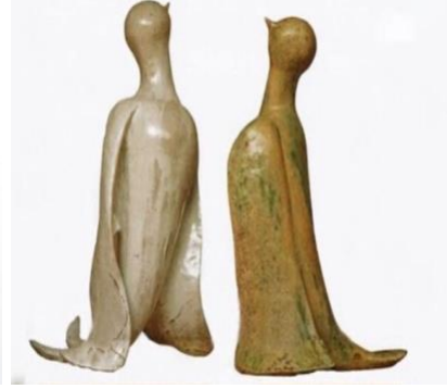
Görsel 7. Kuşlar