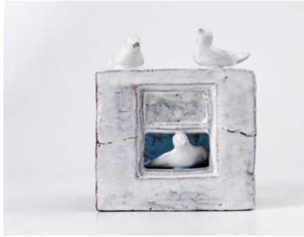
Görsel 8. Füreyya Koral-Evler Serisi