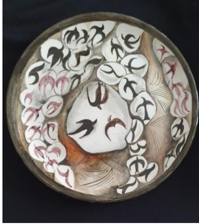
Uygulama 1. Özgür Kuşlar, Emine Cantürk, 2022

Bu çalışma, Füreyya Koral'ın Divan Pastanesi için yapmış olduğu duvar panosundan esinlenerek yapılmıştır. Füreyya Koral'ın özgür ruhunu ve çocukluk özlemlerini içinde hissederek yapmış olduğu kuşları çini tabak üzerine uygulanmıştır. Tabak 30 cm. düz çini tabaktır. Bisküvi tabak üzerine sır altı tekniği ile kahverengi, mangan moru, siyah tonlarında desen uygulaması yapılmıştır. Transparan çini sıırı ile sırlanarak fırınlama işlemi yapılmış ve tabak hazır hale gelmiştir.