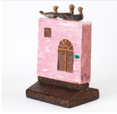
Görsel.10. Füreyya Koral-Evler

Yapıtlarında tekrara girdiğini düşünen sanatçı, en çok bilinen çalışmalarından olan "Evler" serisi ile Sedat Simavi Vakfı ödülünü aldıktan sonra seramiği bıraktığını açıkladı ve kendi dünyasına kapandı. Çok ender de olsa dışarı çıktıkça gördüklerinden çok etkilendi. "Boş gözlerle bakan; nereye niçin gittiğini bilmeyen insanlarla karşılaştığım" ifade eden Koral böylece 1990 yılında "Yürüyen İnsanlar" adlı pişmiş toprak heykelticiklerini üretti. "Yürüyen İnsanlar" adlı serisi, 1992'de 40 sanatçının panolarıyla beraber "40. Sanat Yılında Füreyya Koral'a Saygı" sergisinde Maçka Sanat Galerisi'nde yer aldı (Füreyya Koral, t.y.). Füreyya Koral muhteşem güzellikler içinde süren sanat hayatını ve hayranlıkla anılacak olan hayatını 25 Ağustos 1987 yılında sonlandırdı. 87 yaşında İstanbul'da hayata gözlerini kapattı.