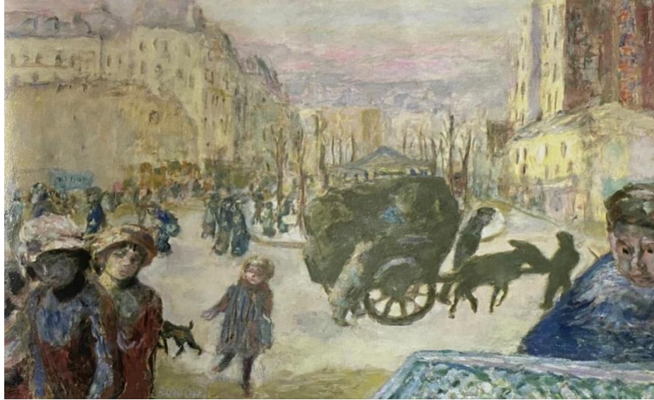
Resim 3 : Pierre Bonnard, "Paris'te Sabah", 1911, Tuval üzeri yağlıboya, 76x122 cm, Hermitage Devlet Müzesi, St. Petersburg, Rusya (Hawksley, 2011, s. 605).

Resim 3 incelendiğinde sanatçı Pierre Bonnard'ın "Paris'te Sabah", isimli eserinde Empresyonist etki görülmektedir. Sanatçı karşılaştığı sahnelerin veya nesnelerin renklerinin belirli kompozisyonlarını anlatarak, rengi ve ışığı tekrar yaratmak istese hangi renkleri kullanacağını günlüklerinde betimlemiştir. Sanatçı genellikle eserlerinde tek ya da birkaç figür kullanmasına rağmen bu eserinde çok fazla figür kullanmıştır. Eserin arka planında yer alan