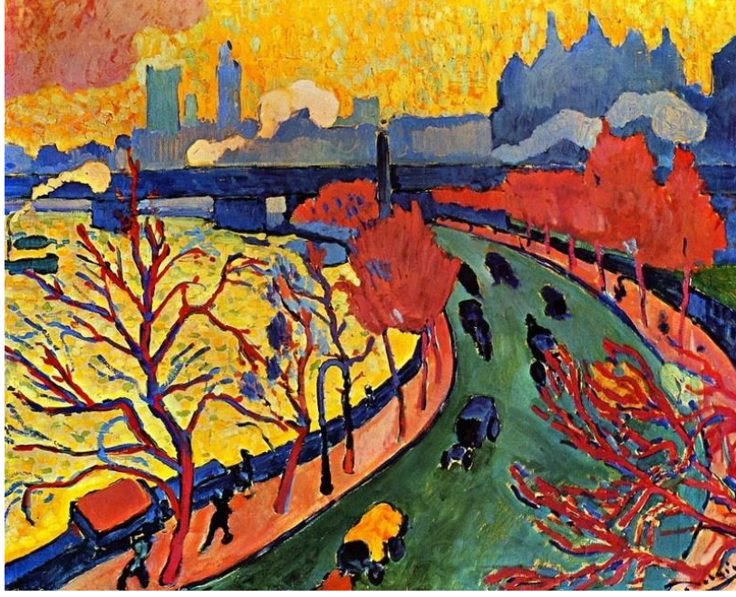
Resim 7: Andre Derain, “Charing Çapraz Köprüsü”, 1901, tuval üzeri yağlıboya, 81x100 cm, d’Orsay Müzesi, Paris (Buchholz, Bühler, Hille, Kaeppe, Stotland, 2012, s. 407).

Resim 7 incelendiğinde sanatçı Andre Derain’ın “Charing Çapraz Köprüsü” isimli eserinde mekân olarak bir manzara resmi görülmektedir. Doğayı endüstri ile birleştiren bu görüntüler Empresyonistler arasında sevilen konular olarak yer almaktadır. Sanatçı bu eserinde eski üsluplara gönderme yapmaktadır. Eserinde görüntüyü öznel ve canlı bir renk paleti ile resmetmiş, Fovizm’in provokatifliğiyle dış mekân görünümünü yeniden yorumlamıştır (Buchholz, Bühler, Hille, Kaeppe, Stotland, 2012, s. 407).