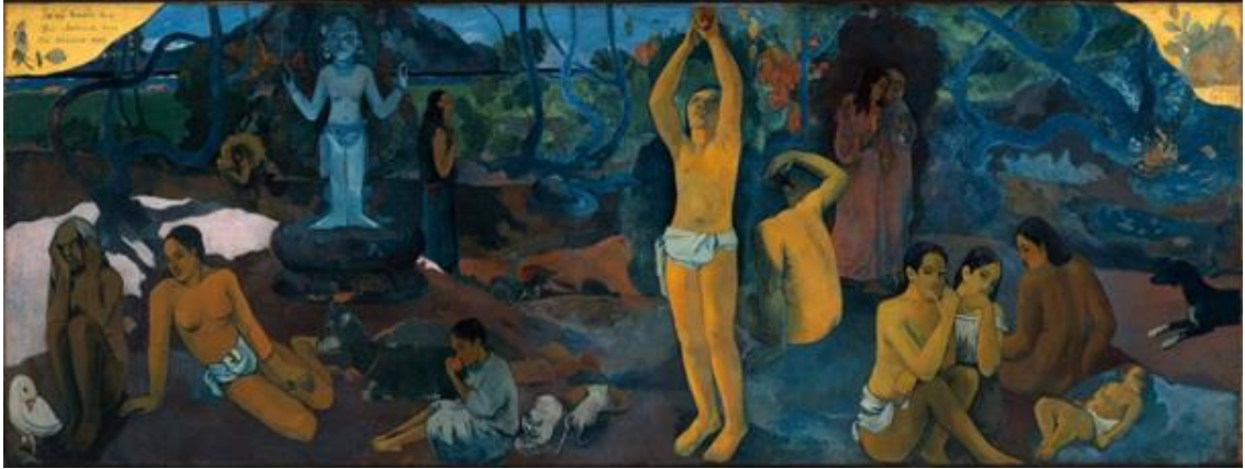
Resim 2: Paul Gauguin, "Nereden Geliyoruz? Biz Neyiz? Nereye Gidiyoruz", 1897, Tuval üzerine yağlı boya, 139x375 cm, Güzel Sanatlar Müzesi, Boston (Walther, 2005a, s. 77).

Mekân açık-koyu kontrastlı renklerden oluşmaktadır. Mekânın orta bölümünden dış mekân görüntüsüyle bulutlar esere dâhil edilmiştir. Eserde iç-dış mekânın bir arada kullanımı etkili bir şekilde ele alınmıştır. Mekân içerisinde figürler alt ve orta bölüme sıralı bir biçimde yerleştirilmiştir.