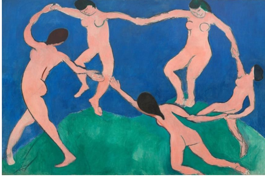
Resim 8: Henri Matisse “Dans I”, 1909, tuval üzerine yağlıboya, 260x390 cm, Modern Sanat Müzesi(MoMA), New York, ABD (Welton, 2006, s. 598).

Resim 8 incelendiğinde sanatçı Henri Matisse’ın “Dans I” isimli eserinde 5 figürün yeşil tepelerden oluşan manzara ve mavi gökyüzünde yerleştirilmiş dans ettiği görülmektedir. Sanatçı son derece yalınlaştırılmış biçimlerle birlikte çarpıcı renkleri kullanmıştır. Dans edenlerden oluşturduğu çember motifi, klasik dönemlerden o güne dek sanatçılar tarafından kullanılmıştır. Dansçılar eserde, ritmik devinim içinde dairesel bir desen oluşturmaktadır. İki tarafa açılmış ellerin birbirine dokunmadığı yerlerde sanatçı dinamik bir gerilim duygusu yaratmıştır (Welton, 2006, s. 598).