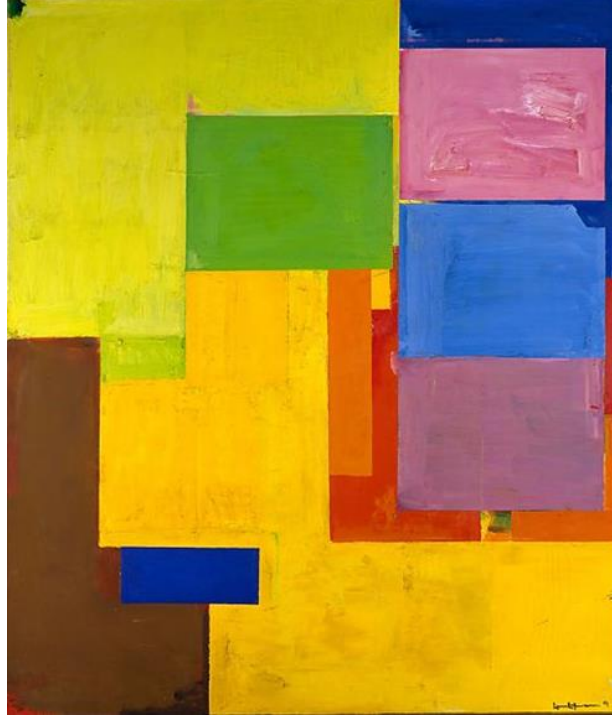
Resim 6: Hans Hoffman, "Aynadaki Tül", 1952, Tuval üzerine yağlı boya, 216,5x186,7 cm, Modern Sanatlar Müzesi, New York, ABD (Kovulmaz, Sabuncuoğlu, 2010, s. 512).

uygulanmıştır. Eserde sırayla incelendiğinde sol bölümdeki figürde turuncu saçlar arka planla karışmış şekilde bir renk kullanımı görülmektedir. Sanatçı ten rengini kumaşta kullanılan renkle karıştırmış ve silik bir görüntü elde etmiştir. Eserdeki renk karışımlarında sanatçı sıcak ve soğuk tonların kontrastından yararlanmıştır. Ten renginde, sarı kullanımı ile turuncunun tonlarından ve açık kontrastlarından faydalanmıştır. Elbisede, açık maviye koyu şekilde uygulanan çizgisel koyu mavi renk kullanımı görülmektedir. Arka plandaki turuncu kullanımı üçüncül mavi renk kullanımıyla kontrastlık sağladığı için resimde denge elde edilmiştir. Renk kullanımlarını tek renk olarak değil de daha çok karışım şeklinde görmekteyiz. Renk doygunluğu açısından ana renk kullanımının az olmasından dolayı renk canlılığı az görülmektedir. Eserde genellikle ana (mavi) ve ara (turuncu) renklerin tonları görülmektedir. Eserde kromatik renk olarak mavi kullanılmıştır.