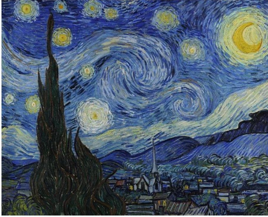
Resim 10: Vincent van Gogh "Yıldızlı Gece", 1889, tuval üzeri yağlı boya, 73,7cm x 92,1 cm, Modern Sanatlar Müzesi, New York, ABD (Walther, 2005, s. 71).

Resim 10 incelendiğinde sanatçı Vincent Van Gogh'un "Yıldızlı Gece" isimli eserine bakıldığında bir manzara resmi görülmektedir. Sarp dağların, servilerin altında Provence'taki St. Remy kasabası civarındaki bir köy eserde yer almaktadır. Samanyolu galaksisi etrafındaki yıldızların yapısı sanatçının kendi yorumu olarak sunulmuştur (Bell, 2009, s. 355). Eserdeki tema dış mekânda geçmektedir. Eser sanatçının dâhil olduğu Yeni İzlenimcilik Akımı özelliklerinin bir yorumu ile yaratılmıştır. Eserde renkler ve figürler, belli bir atmosfer yaratabilmek için sanatçının düş gücüyle bir araya gelmiştir. Gökyüzünde dramatik bir evrensel olay gerçekleşmektedir. Ön planda kısa, kesik fırça dokunuşlarıyla anlatılan sessiz bir kasaba görünümü, gökyüzündeki yuvarlak biçimlerle karşıtlık oluşturmaktadır. Evlerin pencerelerindeki küçük sarı ışıklar dikdörtgen biçimleriyle, yıldızlarla zıtlık yaratarak vurguyu arttırmaktadır (Walther, 2005, s. 72).