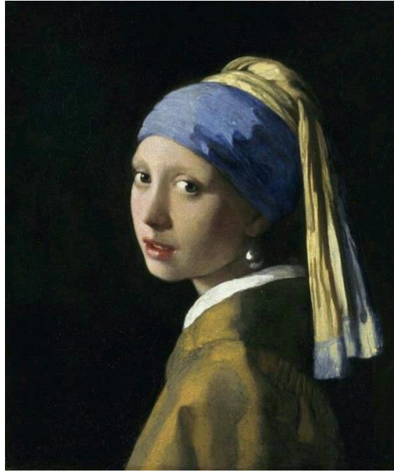
Resim 4: Johannes Vermeer "İnci Küpeli Kız", 1660-61, Tuval üzeri yağlı boya, 46,5x40 cm, Hague: Mauritshuis Müzesi (Cumming, 2006, s. 213).

Resim 4 incelendiğinde sanatçı Johannes Vermeer'in "İnci Küpeli Kız" isimli eseri görülmektedir. Bu eser kimi zaman "Kuzeyin Mona Lisa'sı" ya da "Hollandalı Mona Lisa" olarak adlandırıldığı bilinmektedir. Eser tek figürden oluşan bir portre resmidir. Hollanda'nın altın çağı döneminin önemli çalışmalarından biridir. Eser incelendiğinde koyu bir arka plan ve merkeze orta kısma denk gelecek şekilde yerleştirilmiş bir figür görülmektedir. Arka plan ve figürdeki vurgu, koyu bir yeşil renkle sağlanmıştır. Sanatçının resmin genelinde sıcak ve soğuk renkleri armoni şeklinde kullandığı ve ana renklerden mavi, sarı ve kırmızı tonlarını çok az kullandığı görülmektedir. Eserde hardal sarısı