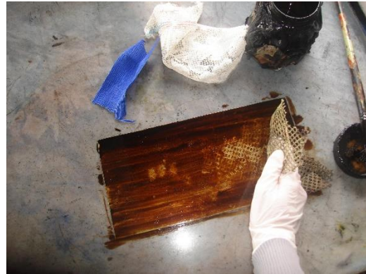
Görsel-2: Uygulama Örnekleri