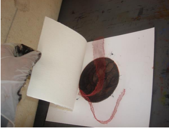
Görsel-5: Uygulama Örnekleri.