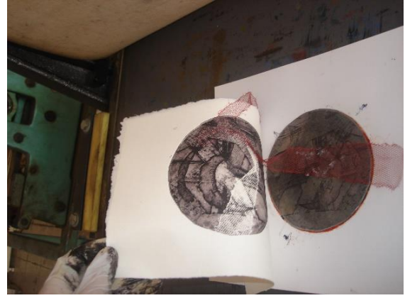
Görsel-6: Uygulama Örnekleri