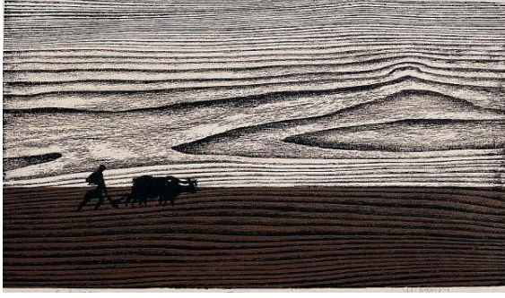
Görsel-7: Muammer Bakır, "Tarla", 1969 Ağaç Baskı, 28 x 50 cm.