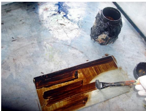
Görsel-1: Uygulama Örnekleri.

Gravür çalışmaları yaparken dokulardan faydalanabilir ve doğada var olan doğal dokulardan, fabrikalarda veya el ile hazırlanmış yapay dokulardan ve sanatsal dokulardan yararlanarak gravür resimlerde kullanılabilir. "Ayrıca çeşitli malzeme çeşitli dokular, yüzeyler ve biçimler elde etmek üzere doğrudan baskıda kullanılabilir." (Özsegin, 1989:140). Doku uygulamaları klasik yöntemlerle uygulandığı gibi. Ayrıca, normal bir gravür kalıbı boya verilip temizlendikten sonra da herhangi bir dokulu yüzeye baskı yapılarak resimde doku elde edilebilir. "Olağan dizi baskının dışında, bir özgün baskı kalıbından özel yüksek nitelikli kağıtlara, keten ve ipek kumaşlara, deriye de baskılar yapılabilir. Az sayıda yapılan bu baskılar da özel olarak imlenirler ve değerlendirilirler." (Özsegin, 1998:136). Baskı resimde kullanılan dokuları seçmek ve bilinçli kullanmak önem arz etmektedir. Kalıba dokulu malzemeyi el ile bastırarak aktarma yöntemlerinden biridir. Bazen kalıpta iz bırakması için dokulu malzeme boyanır ve bastırarak aktarılması sağlanırken, bazen de kalıp vernikle boyandıktan sonra doku bastırılarak aktarma yapılmaktadır.