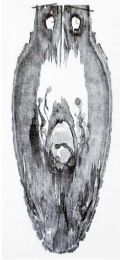
Görsel-13: Hatice Bengisu, "İlişki", Ahşap Baskı, 113 x 64 cm. 2010.

Çalışmaları ile ilgili yapılan bir röportajında sanatçı Bengisu; "Bolu ağaç yönünden zengin bir yapıya sahiptir. Burada ağaç kesme atölyelerini görmem, farklı ağaç plakalarıyla karşılaşmam; beni ağacın dikine kesit plakalarıyla çalışmaya yöneltti. Ağaçların iç yapısındaki dokusal çeşitlilik ve zenginlik beni çok heyecanlandırmış ve ağaç ile sonsuz bir yolculuğa çıkarmıştı. Çalışmalarımdeki figüratif kompozisyonlar kendiliğinden daha soyut formlara ve biçimlere dönüştü. Çalışmalarım farklı bir boyuta geçti. Süreç içinde dikey kesitten oluşturulmuş ağaç kalıplar ile birlikte enine kesit kalıplar da kullanmaya başladım. Şaşırtıcı ve çok farklı sürprizler sunan amorf kalıplar ile ağaç baskı serüvenim devam ediyor". Şeklinde doğal doku kullanımını ifade etmiştir. (Aydoğan, 2017:1)