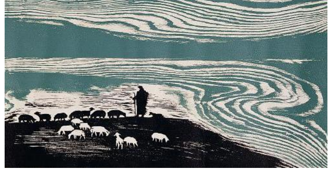
Görsel-8: Muammer Bakır, "Çoban", 1975, Ağaç Baskı, 28 x 54 cm.