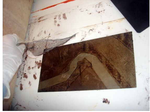
Görsel-4: Uygulama Örnekleri.

Hazırlanan kalıp gravür tekniklerinden biri olan asite yedirme yöntemi ile asit ve su karışımından hazırlanan asit küvetinde bekletilmektedir. Asit dokulu kısımlar verniksiz olduğu için asit bu kısımları çukurlaştırmaktadır. Bu yöntemde aşamalı olarak kalıbı kısım kısım vernikle kapatıp dört beş aşamada koyuluk derecelendirmesi yapılmaktadır. Dokuların aynı derecede koyu veya açık olması istendiği zaman tek seferde asitte bırakılmaktadır. Kalıbın baskısı alındığında istenilen dokulu yüzeyin görüntüsü çıkmış olmaktadır.