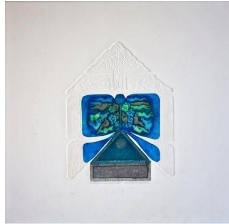
Görsel-10: Mürşide İçmeli, "Mavi Kurdele", 2001, Gravür.