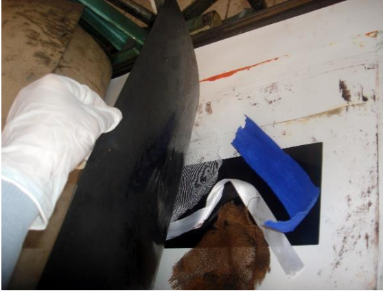
Görsel-3: Uygulama Örnekleri.

Doku aktarmada en çok kullanılan yöntemlerden biri de presle aktarmadır. Dokuyu kalıba presle aktarmak için önce bazı ön hazırlıklar yapmak gerekmektedir. "Metal plak üzerine yumuşak lak sürülüp, bu lakın üzerine çeşitli malzemelerle baskı yaparak istenilen doku izleri elde edilebilir" (Özsezgin, 1989:146).