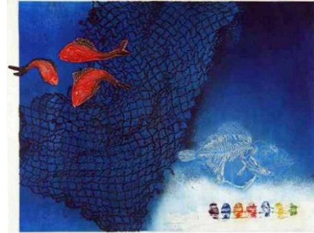
Görsel-12: Güler Akalan, "Yok Ediş", Gravür, 51 x 66 cm

"Kılıç Yarası" (Görsel-11) isimli çalışmada sanatçı, resmin orta alanındaki kılıç balığı dokulu yüzey olan balık ağlarını keserek resimde merkezi vurgulamaktadır. (Görsel-12) sanatçının "Yok Ediş" isimli çalışması ağ dokularının yüzeyinde bulunan kırmızı balıkların ağlardan kurtulmaya çalışma anlarından bir kesit sunmaktadır. Çalışmada plaka yüzeyleri verniklendikten sonra vernik kurumak üzere iken yüzey üzerine yerleştirilen kumaş dokuları ile plakanın aynı anda presten geçirilmesi sonucu kumaşın doku izlerinin vernikli alanı açması ve asite atıldığında da plakanın bu açık alanlarından derinleşmesi ile oluşturulmuştur. Plakaya ana renk verildikten sonra yüzey ya temizlenmeyerek ya da merdane ile mavi boya verilerek aynı rengin hakimiyeti devam ettirilmiş, bazen de lokal renklendirme yolu ile küçük alanlarda farklı renkler resme ilave edilmiştir.