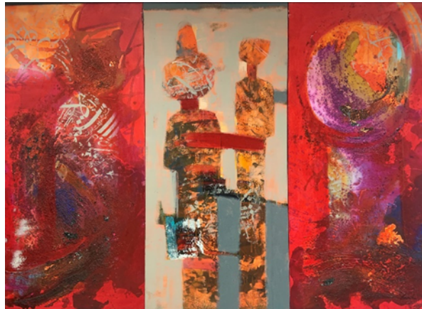
Görsel-8: Mutluhan Taş, "Balballar ve Mevlevi Mezar Taşları". T.Ü.A.B.140x180.2013.

Mutluhan Taş, Türk kültürünün derinliklerinden ilham alarak, resimlerinde balballar ve mezar taşlarını stilize figüratif bir anlayışla sıkça kullanmaktadır. Türklerin İslam öncesine ait Şaman inançlarının da etkisi olduğu düşünülen balballar ölmüş kişilerin ruhlarına bekçilik yapan kutsal taşlardır (İba, 2020:88). (Görsel-8)