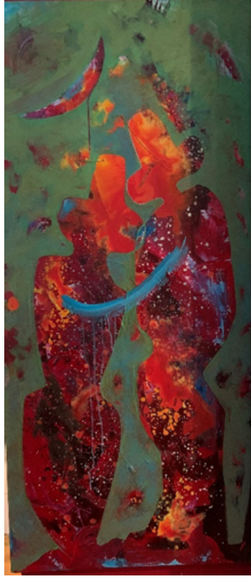
Görsel-11: Mutluhan Taş, "Mevlevi Mezar Taşları". T.Ü.A.B.140x180.2015.

Taş'ın eserlerinin arka planını bilinmeyen bir evreni çağrıştıran zengin renk geçişleri (Taş.2012: 118-125) ve kaligrafik düzenlemeler oluşturur. Bu mistik etki, evrenler arası varoluşun ve hayatın ontolojik çözümlerini plastik bir ifadeyle sorgulamanın çağdaş dili olarak kabul edilebilir.