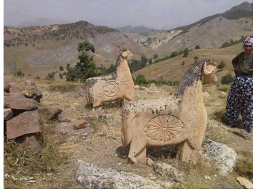
Görsel-3: Koç başlı mezar taşları. Tunceli. (Sanal,2024)

Türkiye Selçuklu Devleti'nin en büyük Sultanı olarak kabul edilen I. Alâeddin Keykubat zamanında Konya'ya davet edilen Hz. Mevlâna ve ailesi, XIII. Yüzyıldan günümüze süregelen Mevleviliğin ve Mevlevi kültürünün Konya merkezli Tüm Anadolu, Kıbrıs, Ortadoğu ve Balkanlarda yayılıp yaşamasına sebep olmuştur. Bu kültürün içerisinde Mevlevi mezar taşları önemli bir yer tutmaktadır. Mezar taşının üzerinde ölen kişinin makamı ve görevleri övgülü bir dilde yazılırken taşın en üst kısmında ölen kişinin derviş, şeyh ya da çelebi soyundan olup olmadığına ait bilgiler, sikkenin ve destarin formundan rahatlıkla anlaşılabilir. (Görsel 4)