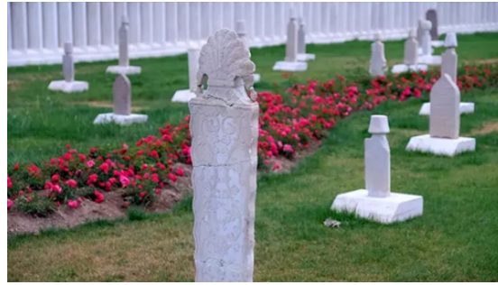
Görsel 4: Mevlâna Türbesi haziresinde bulunan mezar taşları. Konya (Sanal, 2024)

Türkiye Selçuklu Devleti'nin en büyük Sultanı olarak kabul edilen I. Alâeddin Keykubat zamanında Konya'ya davet edilen Hz. Mevlâna ve ailesi, XIII. Yüzyıldan günümüze süregelen Mevleviliğin ve Mevlevi kültürünün Konya merkezli Tüm Anadolu, Kıbrıs, Ortadoğu ve Balkanlarda yayılıp yaşamasına sebep olmuştur. Bu kültürün içerisinde Mevlevi mezar taşları önemli bir yer tutmaktadır. Mezar taşının üzerinde ölen kişinin makamı ve görevleri övgülü bir dilde yazılırken taşın en üst kısmında ölen kişinin derviş, şeyh ya da çelebi soyundan olup olmadığına ait bilgiler, sikkenin ve destarin formundan rahatlıkla anlaşılabilir. (Görsel 4)