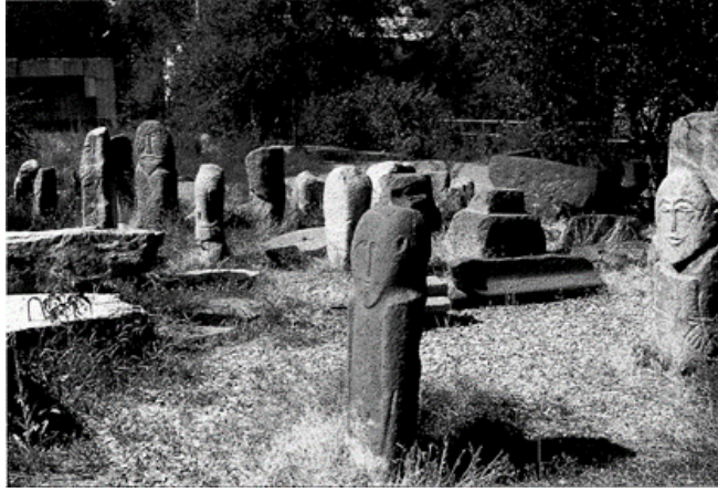
Görsel-1: Balballar. (Çoruhlu.2001:117)

Geç Bronz çağından itibaren karşımıza çıkan balballar, Merkezi Asya başta olmak üzere Güney Sibirya'da yaşayan eski Türkler tarafından ölen şahsın anılması için mezarının yanına veya kurganların etrafına dikilen taş heykellerdir (Türker, 2009:38) İskitler döneminde mezar etrafının yanı sıra anma ve özel törenlerin yapıldığı yerlere de dikilmiştir. Ekseriyetle Göktürkler döneminde yaygın olarak kullanılan balballar, Orta Asya'dan Anadolu'ya kadar yayılmıştır. Türkler hem İslâm öncesinde hem de İslam sonrasında ölen yakınlarının ve devlet adamlarının bu gibi anıt ve heykelleri, ölen kişiyi bu dünyada sembolik olarak temsil eden araçlar olarak kullanılmışlar, diktikleri anıt ve balbalların karşısında saygı ile eğilerek onlara kurban sunmuşlardır (Efendiyev, 1980:12).(Görsel-1) Kızlasov'a göre; Balballar öldürülen düşmanı sembolize etmek için, onun mezarı etrafında dikilen taşlara denilse de, (Kızlasov, 2005:697) Emel Esin; "Türk Alpleri için yapılan mezarlarda, savaşta öldürülen düşmanların ruhlarını temsilen "balbal" adında yontulmamış, sade tahta veya taşlar dikildiğinden bahseder."(Esin,1997:6). Jean-Paul Roux da kendi eserinde; Buna benzer şekilde, öldürülen düşmanları temsil etmek için şekilsiz, yekpare, dikdörtgen taş dikildiğini, Ata diye adlandırılan tanınmış ve saygın ölüleri temsil etmek için ise gömüt heykeller olan balbalları diktiklerini söyleyerek bu ikisini birbirinden ayırt etmek gerektiğini vurgular (Roux,1994: 35).