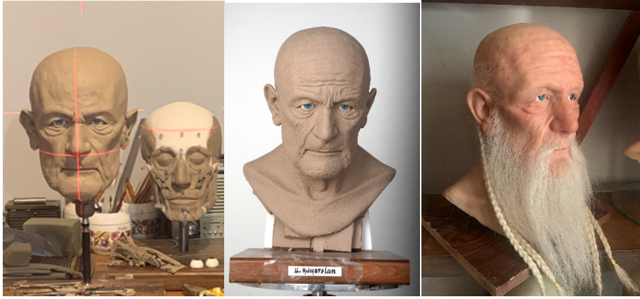
Görsel-5-6-7: II.Kılıçarslan'a ait yeniden yüzlendirme aşamaları.(Taş.M,Akpolat,E.2023:486-488)

Türkiye'de 21 müzede 400 ün üzerinde hiperrealist silikon heykeli bulunan sanatçı, Türkiye Selçuklu Sultanlarının kimliklerinin tespiti ve yeniden yüzlendirilmesi projesinde bilim kurulu üyesi ve uygulamacı heykeltıraş olarak görev yaptı. (Akpolat, E., Taş, M. 2023). (Görsel.5-6-7)